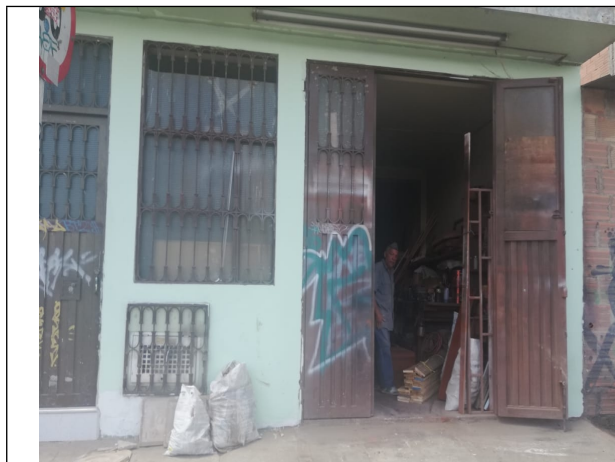
Fotografía No 1. Fachada predio